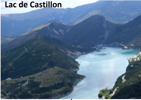
Lac de Castillon